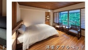
洋室ダブルベッド