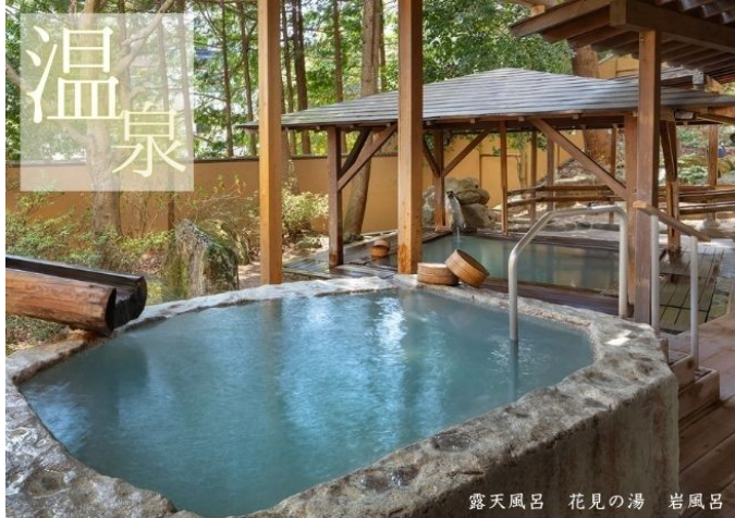
露天風呂 花見の湯 岩風呂