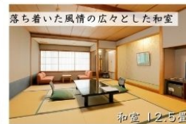
落ち着いた風情の広々とした和室