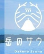
岳のサウナ Dakeno Sauna