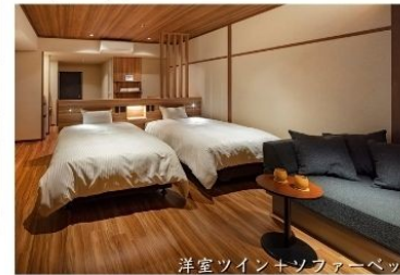
洋室ツイン+ソファ+ベッド